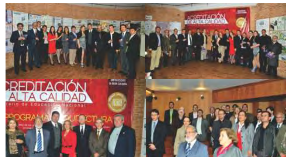
Aspecto gráfico del acto realizado en la Sociedad de Arquitectos de Bogotá con motivo del reconocimiento entregado por el gobierno a la Facultad de Arquitectura de la Universidad La Gran Colombia.

formación de nuestra nacionalidad: el doctor Luis López de Mesa, reconocido por su labor intelectual durante el Siglo XX, y quien ocupó, entre otros cargos, el de Ministro de Educación Nacional.