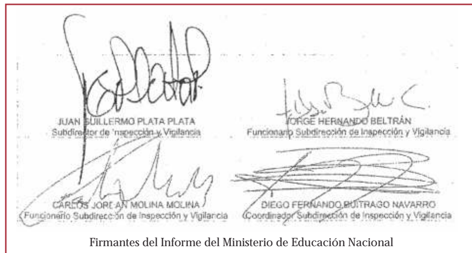
Firmantes del Informe del Ministerio de Educación Nacional