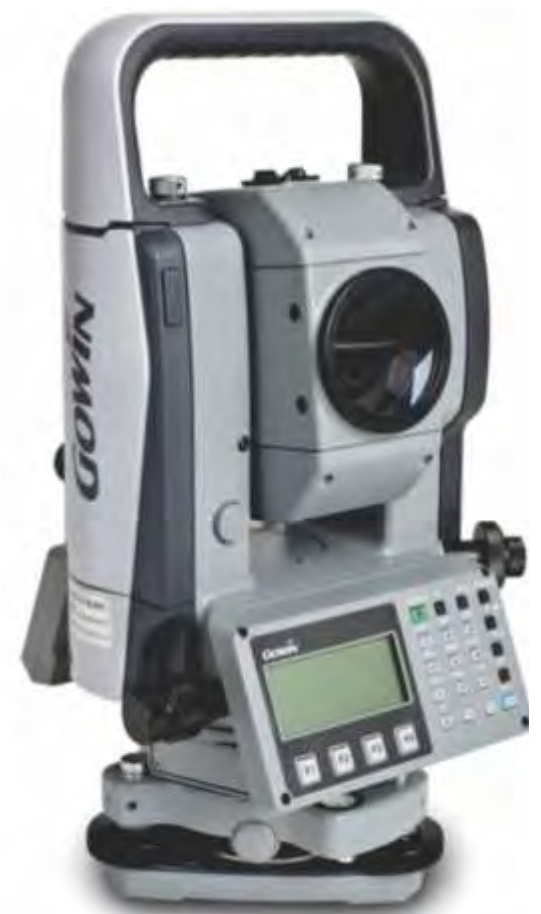
Estación Total Electrónica Gowin TKS 202.