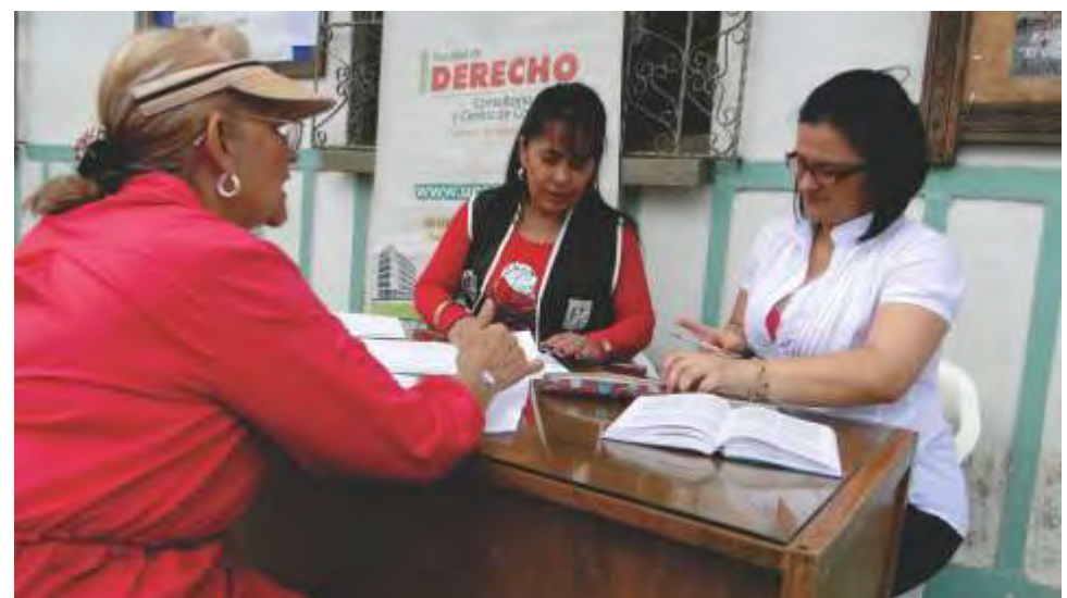
Brigada jurídica de la Seccional Armenia en el municipio de Circasia - Quindío.

Así, 2013 será para la Universidad La Gran Colombia - Seccional Armenia- un año de grandes retos y apuestas no sólo en el ámbito académico, sino en materia de proyección social, como ha sido característico en la historia de esta institución, cuya trayectoria y protagonismo la hacen hoy un referente para nuestra región