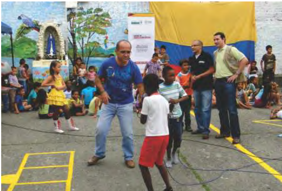
Jornada de atención integral a la comunidad del asentamiento "El Milagro de Dios" en Armenia por parte de la Universidad.

Conclusiones de una universidad pensada desde la perspectiva humanista