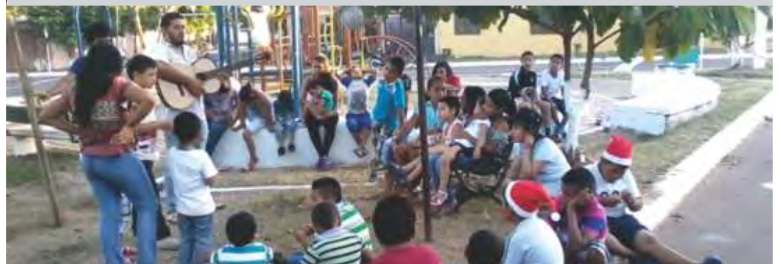
Apostolado con niños del Barrio Carimagua de Puerto Gaitán.