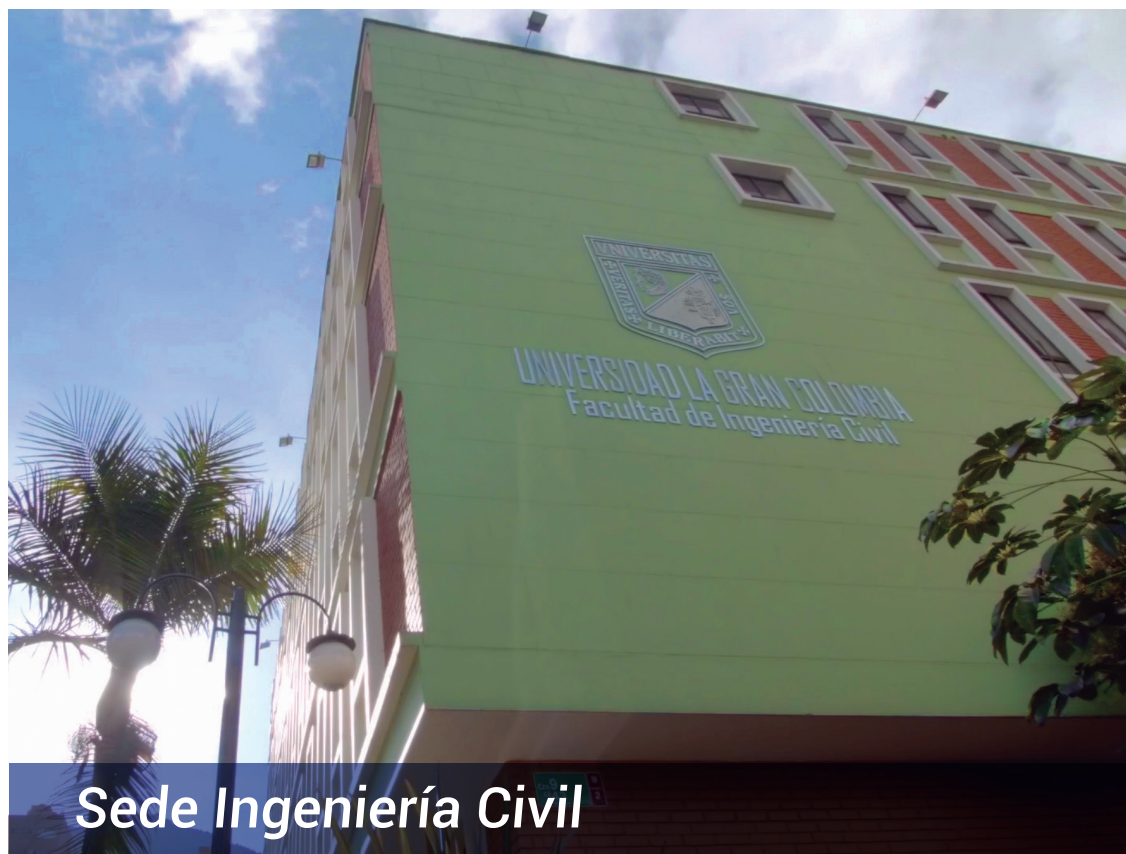
Sede Ingeniería Civil