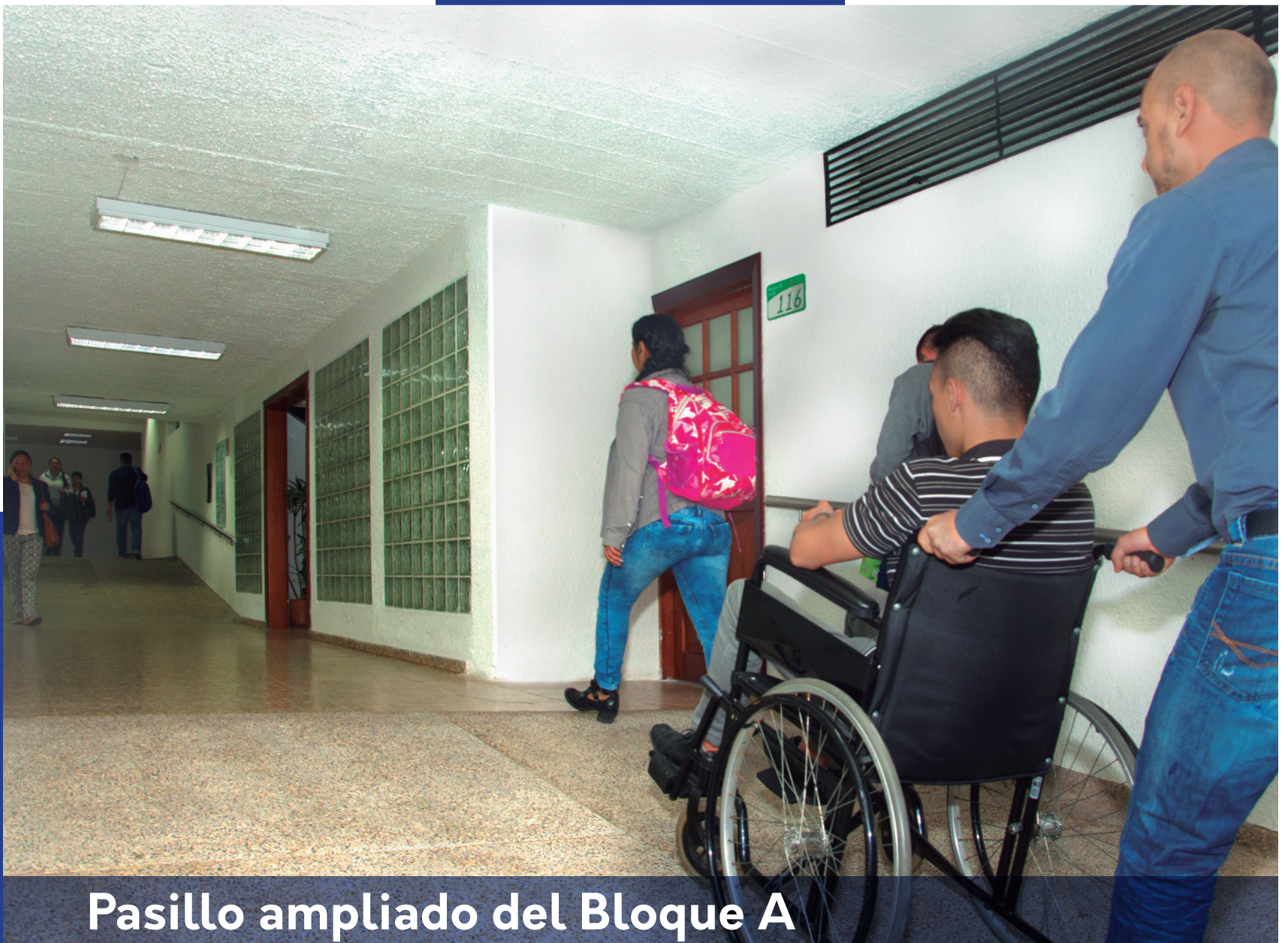
Pasillo ampliado del Bloque A

“Además de las anteriores intervenciones fueron realizados trabajos en espacios académicos y administrativos.”