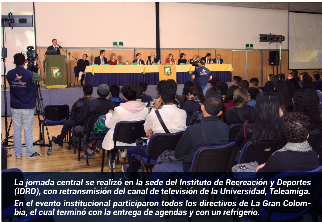
La jornada central se realizó en la sede del Instituto de Recreación y Deportes (IDRD), con retransmisión del canal de televisión de la Universidad, Teleamiga. En el evento institucional participaron todos los directivos de La Gran Colombia, el cual terminó con la entrega de agendas y con un refrigerio.

Los nuevos alumnos fueron distribuidos en todos los auditorios: Salón de los Virreyes, Simón Bolívar, Julio César García, Noel Acosta de Ingeniería Civil y auditorio y sala de Postgrados. Guiados por funcionarios de la Universidad, los nuevos estudiantes, cerca de mil, recorrieron las diferentes instalaciones de la Institución.