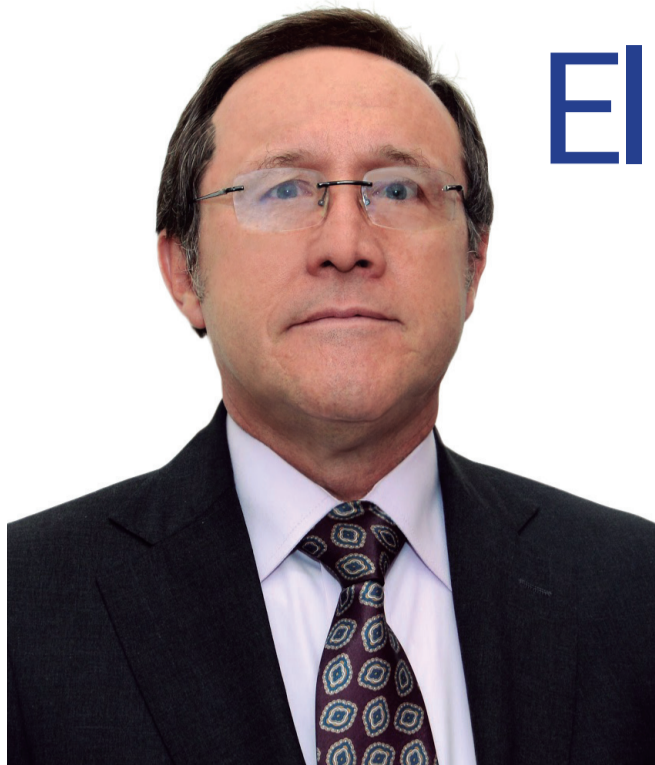
Por Marco Tulio Calderón, Vicerrector Jurídico