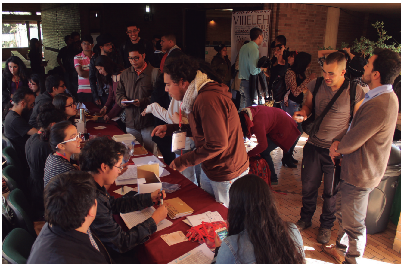
Estudiantes de América Latina atendieron el llamado al espacio de intercambio académico y cultural.

Este permitió a los estudiantes de Ciencias Sociales y Humanas compartir experiencias académicas y proyectar investigaciones conjuntas