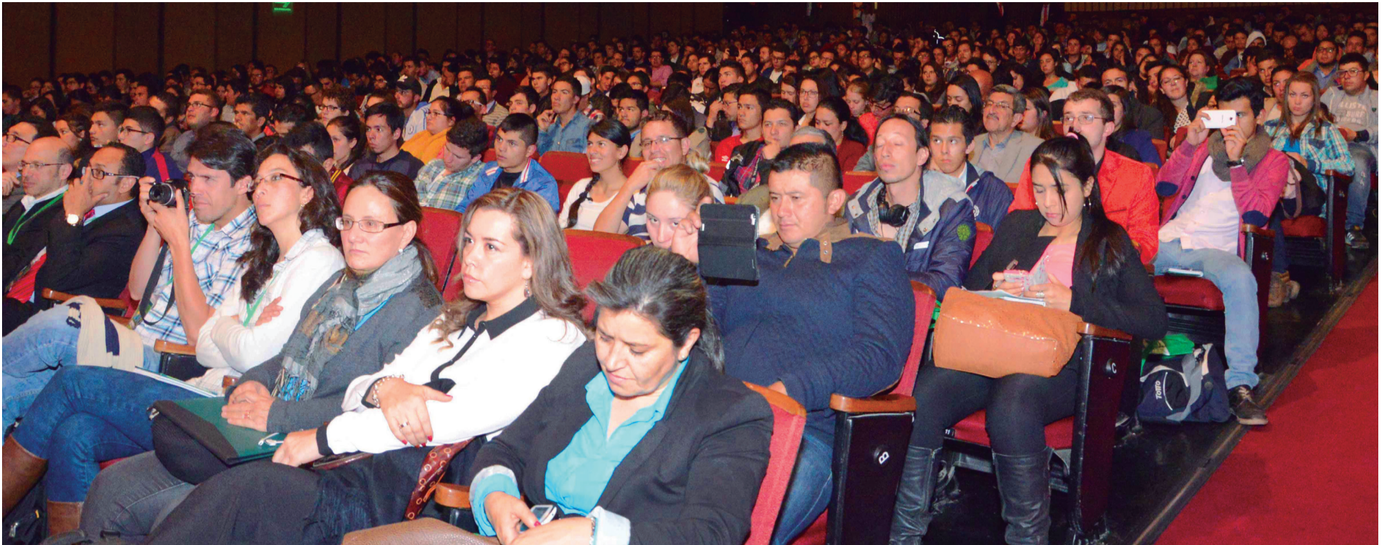
Asistentes al congreso internacional de Ecociudades.