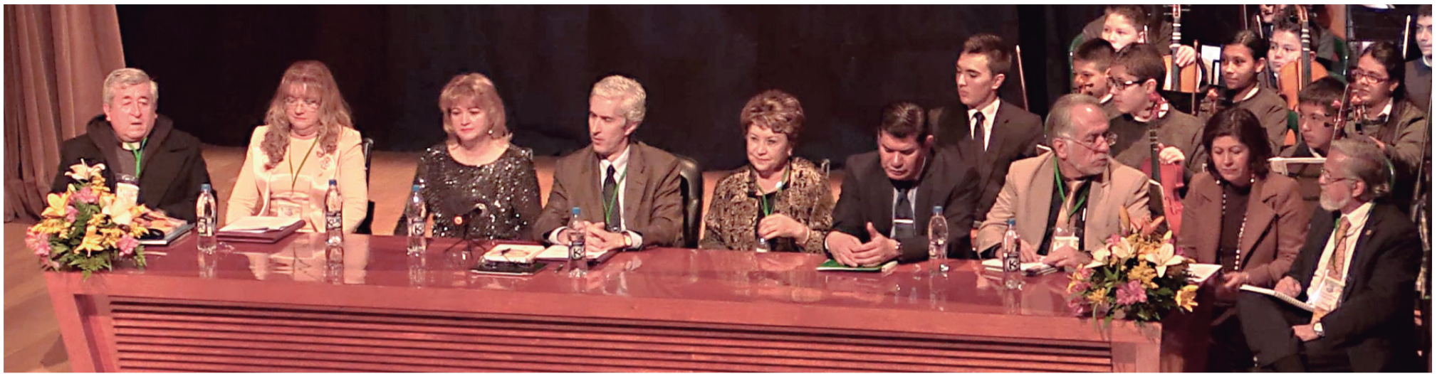
Directivos y decanos presiden el congreso internacional de educación.