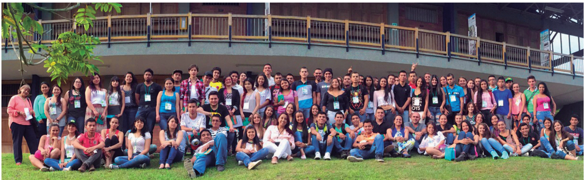
Estudiantes de Ingeniería Geográfica y Ambiental en el campus de la Seccional Armenia.

Al cierre de la actividad, los grupos de las dos universidades recorrieron las instalaciones del campus Ciudadela del Saber La Santa María, sus laboratorios y apreciaron la exhibición de trabajos del Proyecto Integrador.