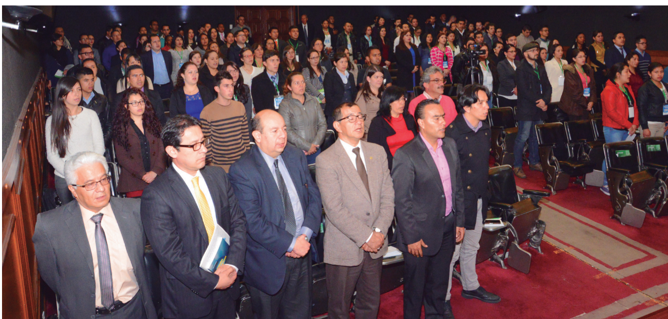
Asistentes al tercer seminario internacional sobre valoración de empresas.

La realización de este seminario internacional en valoración de empresas ha sido un aporte importante en la coyuntura actual, donde Colombia está ajustando toda su normatividad y transición hacia las Normas Internacionales de Información Financiera. Las más beneficiadas han sido y serán las Pymes, que representan, en su mayoría, la estructura empresarial colombiana.