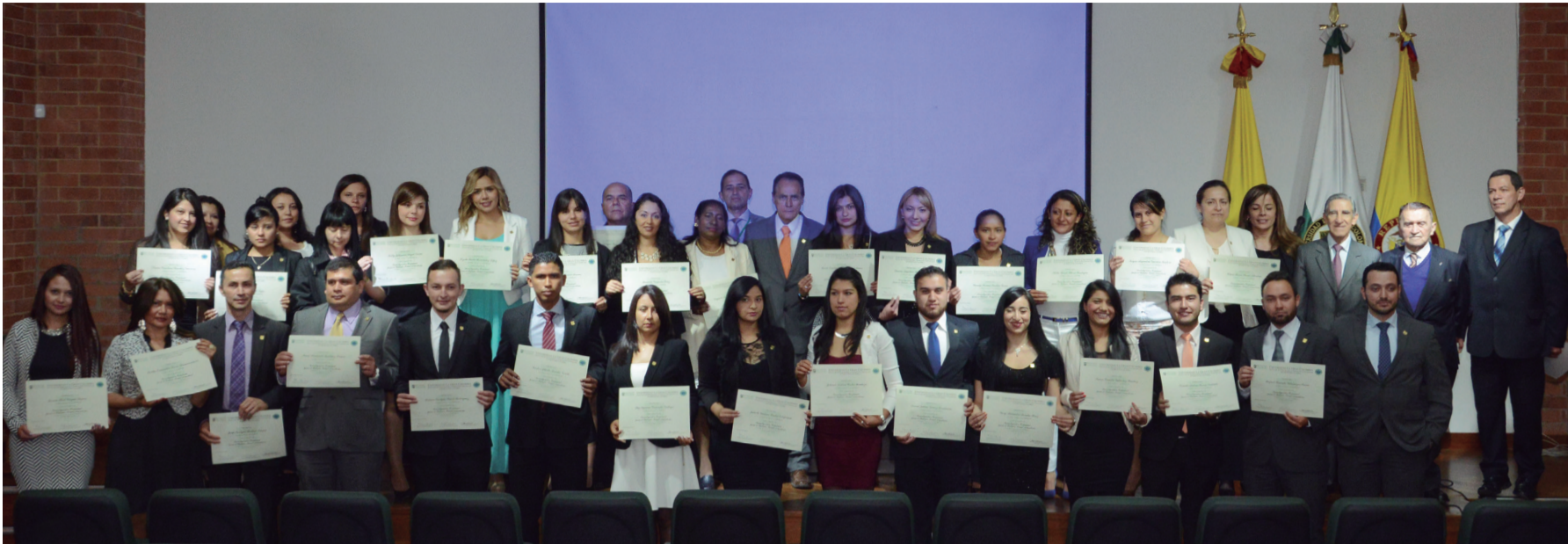
Estudiantes capacitados en investigación criminal por la Universidad.