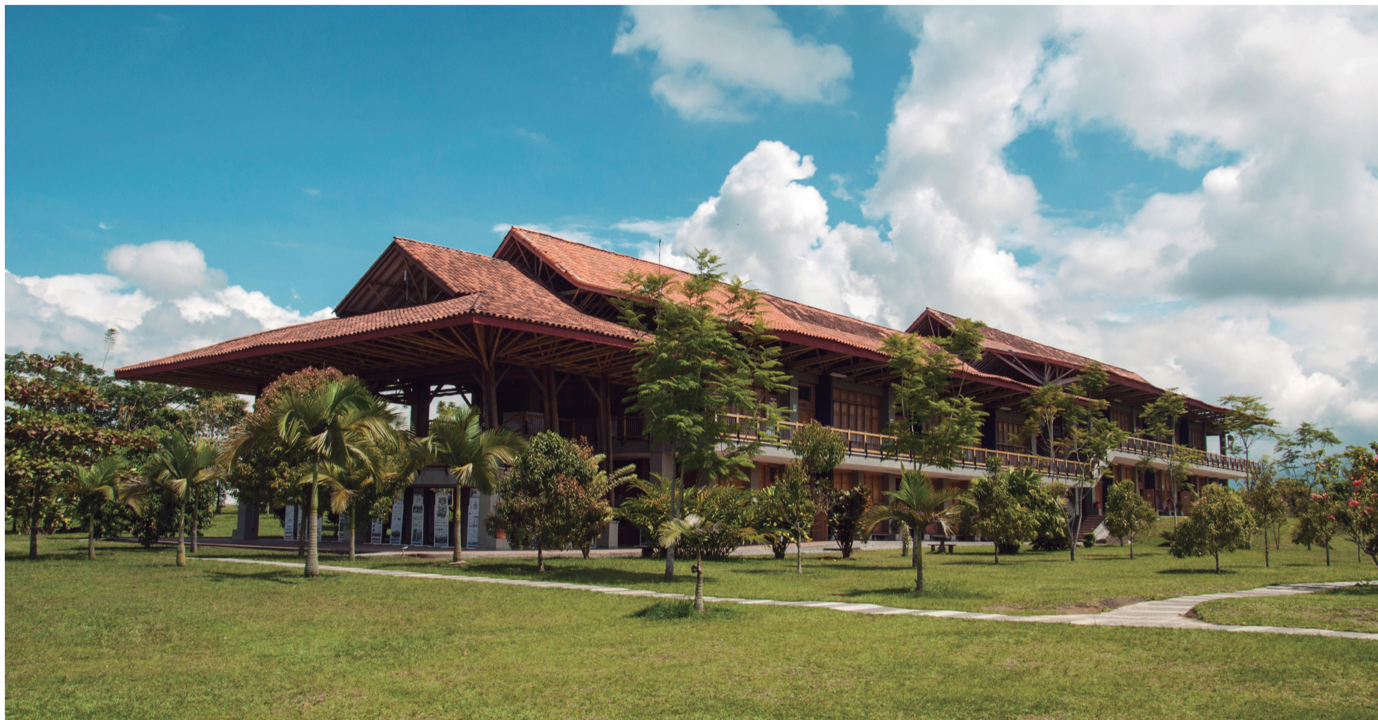
Campus Universitario Ciudadela del Saber La Santa María, Armenia.

Con más de 1.200 asistentes, el 19 y 20 de agosto pasado la Seccional Armenia y su Facultad de Derecho y Ciencias Políticas realizaron en el Centro Cultural Metropolitano de Convenciones de Armenia el Congreso de Justicia Transicional: un aporte a la paz de Colombia.