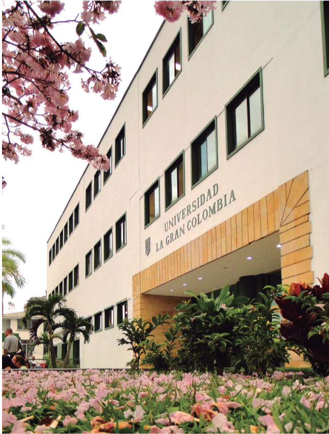
Seccional Armenia. Sede Centro.

En el acta de veredicto también resaltó "el elegante