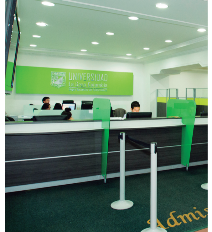
Ampliación de la oficina de Admisiones.

La remodelación de la oficina de la Secretaría General consistió en el cambio del piso, buscando la armonía con la edificación, se realizó el mantenimiento general de pintura y resanes en muros y cielo rasos, cambio de lámparas e instalación de nuevo mobiliario, fabricado en madera y con divisiones en vidrio templado para brindar mayor comodidad a funcionarios y usuarios.