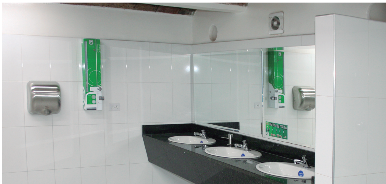
Remodelación de baños plazoleta facultad de Arquitectura.