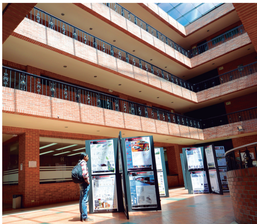
Facultad de Postgrados.

El equipo de trabajo de la Facultad de Postgrados y Formación Continuada informó que viene trabajando intensamente en cuatro ejes fundamentales: internacionalización, apertura de programas, autoevaluación e investigación.