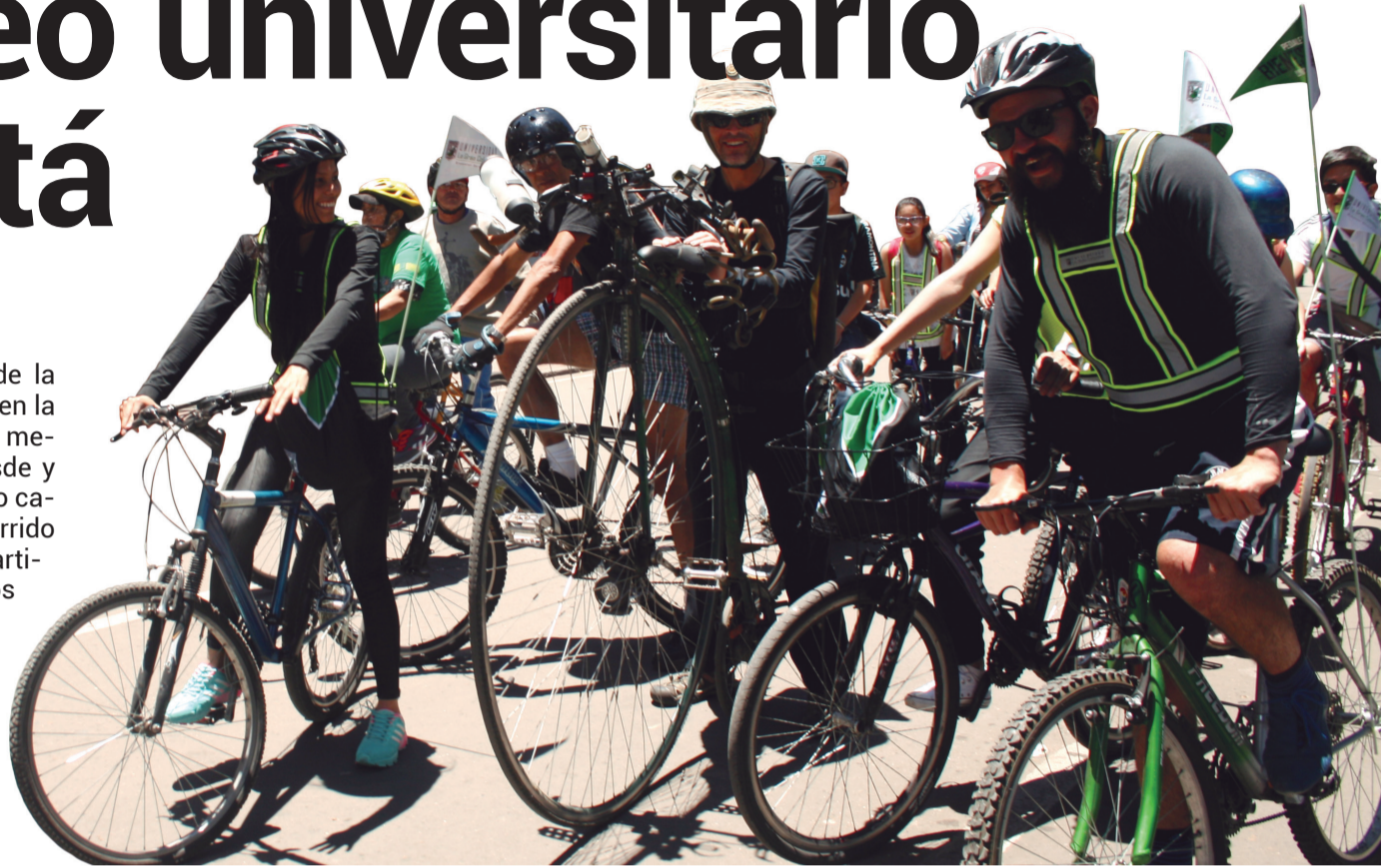
Estudiantes de la Universidad en el ciclopaseo.

Este recorrido se inició en la Plaza Simón Bolívar y recorrió varias calles de La Candelaria, siguiendo por algunas de las arterias más importantes de Bogotá hasta llegar al Parque Metropolitano Simón Bolívar. Un grupo de docentes de la Coordinación de Deportes dirigió el ciclo paseo.