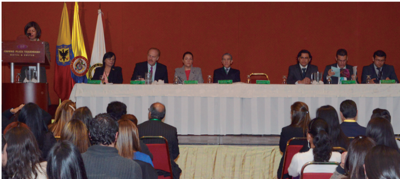
IV congreso internacional de Derecho Penal.

Entre las conclusiones, el Congreso le permitió a la comunidad académica reflexionar en cuanto a lo que seguirá después de firmar el acuerdo de paz y los retos del postconflicto, que incidirán en la justicia y la sociedad colombiana.