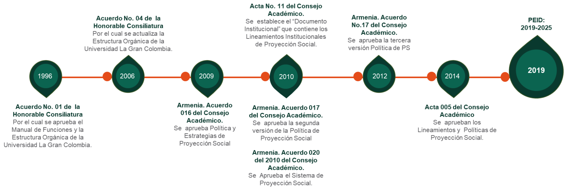
Figura 1. Hitos de la proyección social en la UGC.