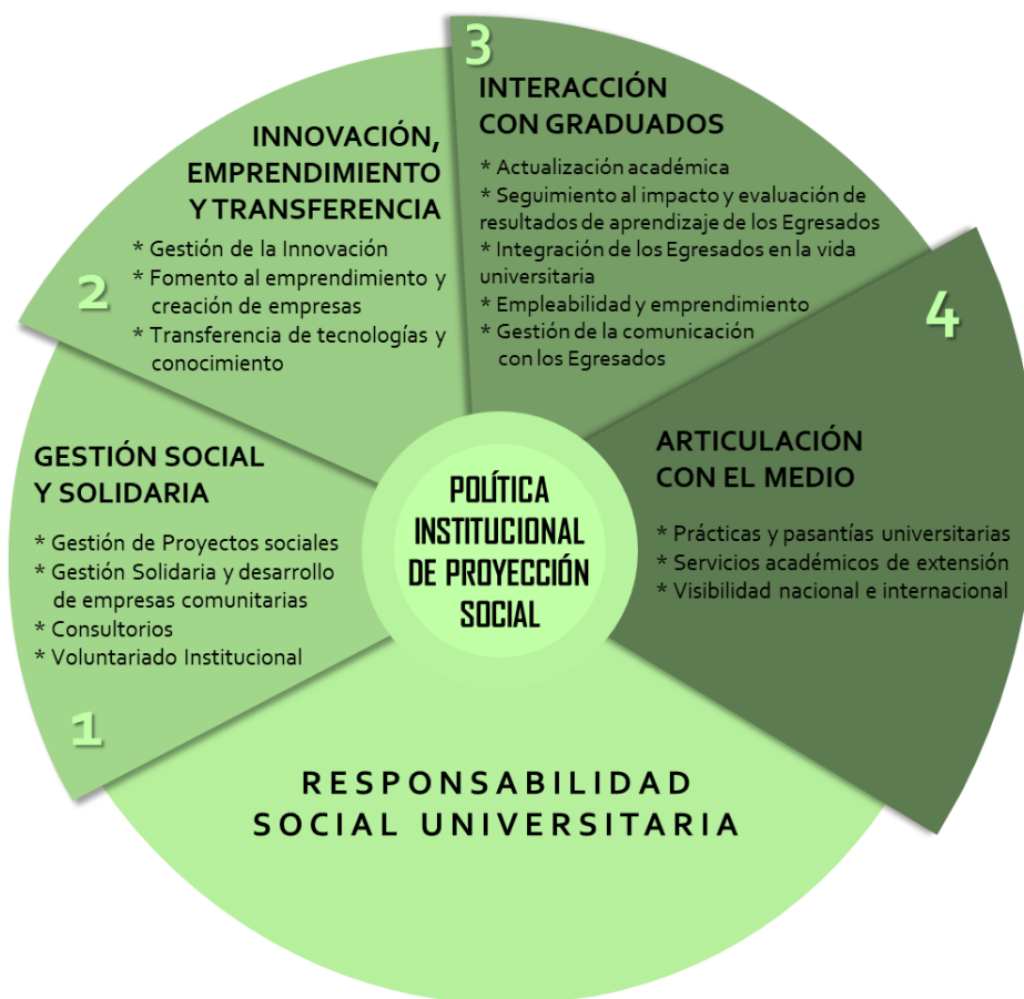
Figura 2. Líneas de acción y estrategias de implementación.