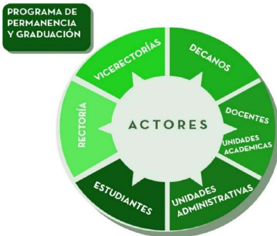
Figura 5. Articulación entre Áreas