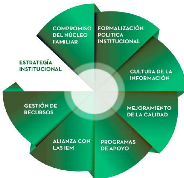
Figura 4. Estrategia Institucional.