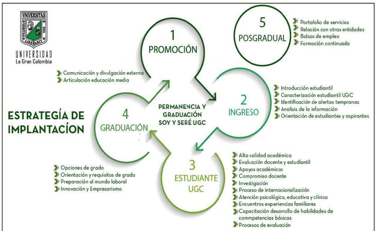
Figura 3. Estrategia de implementación.